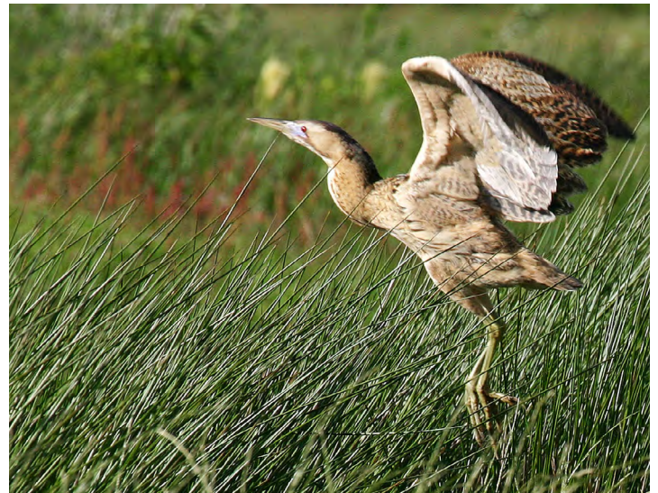
Roerdomp, zeer zeldzaam.