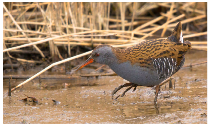
Waterral, laat zich zelden zien.