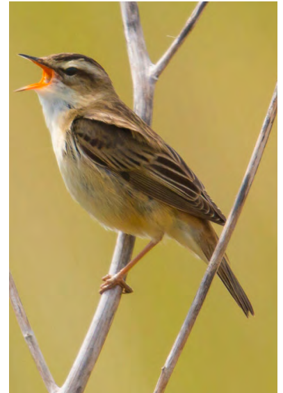
Rietzanger, uitbundig zanger.

De dijkviltbraam heeft de afgelopen jaren grote delen van Weideveld overwoekerd. Deze plant groeit snel en vormt dichte struiken, soms wel meer dan drie meter hoog. Andere planten krijgen hierdoor geen kans. De braam wordt dan ook verwijderd. In februari is het eerste deel al aangepakt. Omdat de plant niet goed tegen natte grond kan, is de verwachting dat die minder snel terugkomt. Zo ontstaat weer ruimte voor riet, zeggen, lisdodde en andere typische moerasplanten.