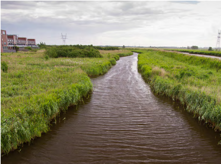
Stukje van het natuurgebied Weideveld.

Landschap Noord-Holland start met een grote verbetering van natuurgebied Weideveld om de natuur hier sterker en gezonder te maken. Weideveld is onderdeel van het Natuurnetwerk Nederland (NNN) en is belangrijk voor de ontwikkeling van een goed moerasgebied.