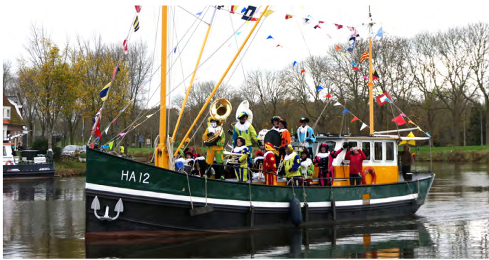
De aankomst van Sinterklaas.

De binnenstad van Purmerend toverde om tijdens de intocht van Sinterklaas. Het was zichtbaar druk: kinderen, ouders, opa's en oma's stonden rijen dik langs de route om Sint en zijn pieten een warm welkom te geven. Er werd gezongen, gezwaaid en veel gedanst. Dit jaar had de intocht een extra feestelijk tintje, want 'De Grote Sinterklaasfilm' is deels Purmerend opgenomen .