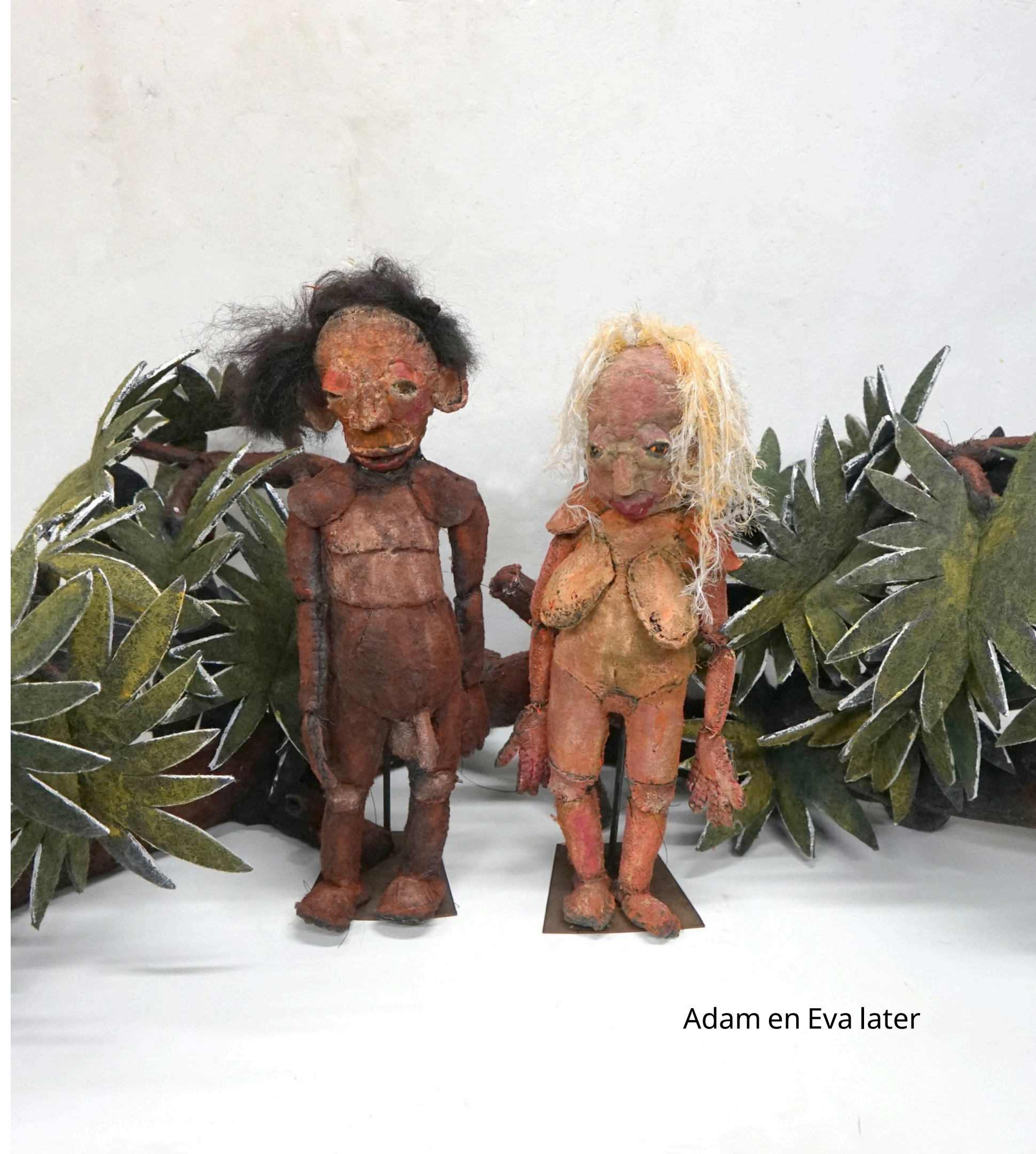
Adam en Eva later