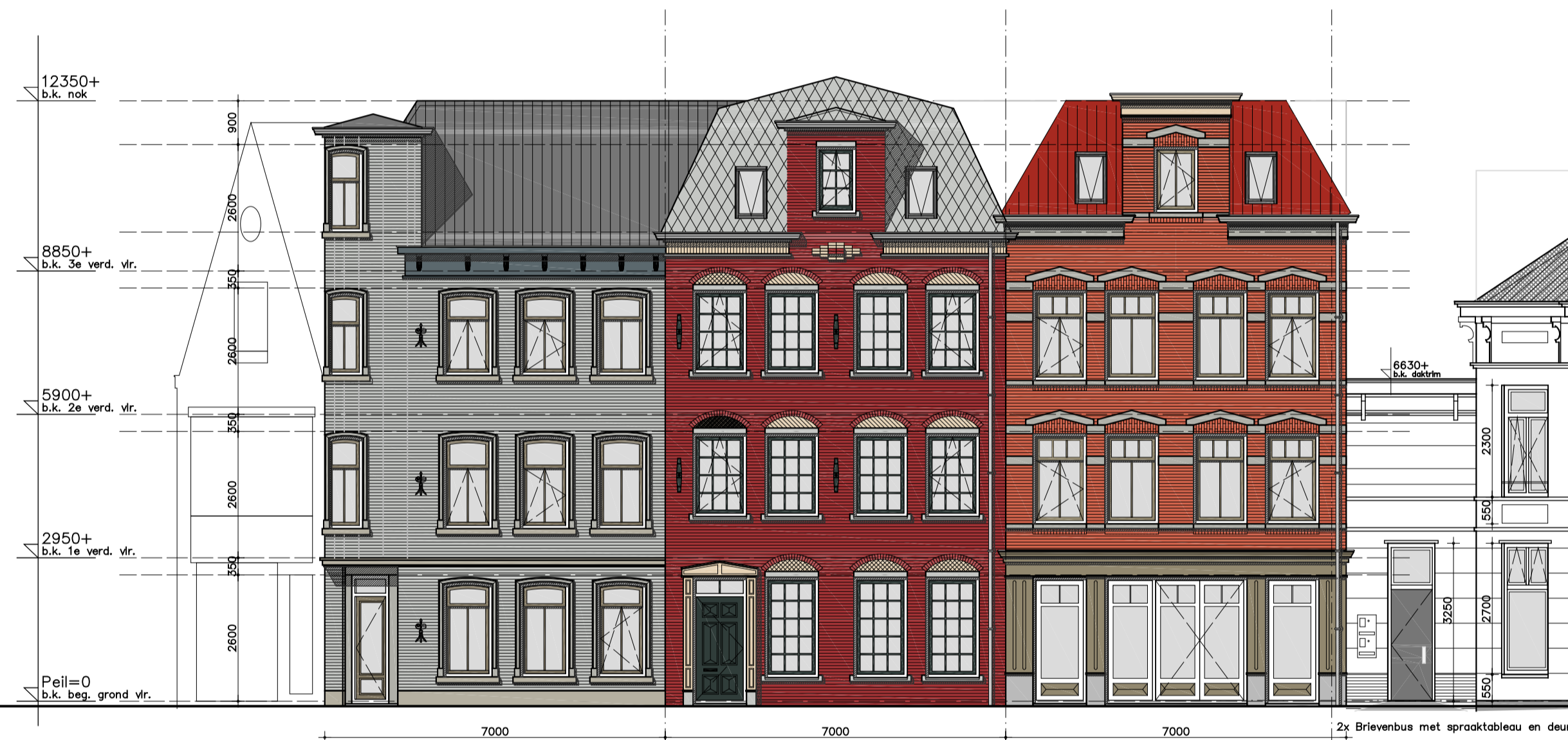
GEVEL TRAMPLEINZIJDJE NIEUW